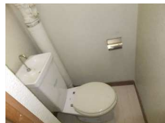
※同様タイプの写真になりますので、募集の部屋と異なる場合があります。