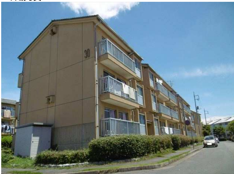
※同様タイプの写真になりますので、募集の棟と異なる場合があります。