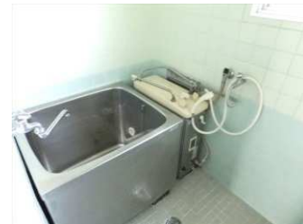
※同様タイプの写真になりますので、募集の部屋と異なる場合があります。