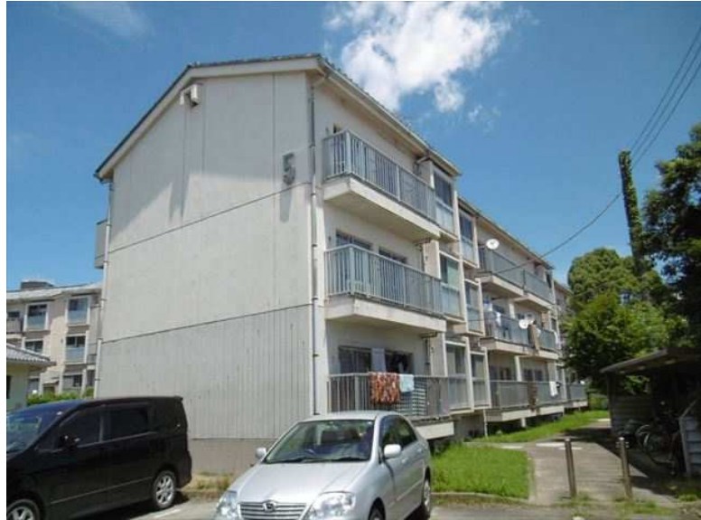
※同様タイプの写真になりますので、募集の棟と異なる場合があります。