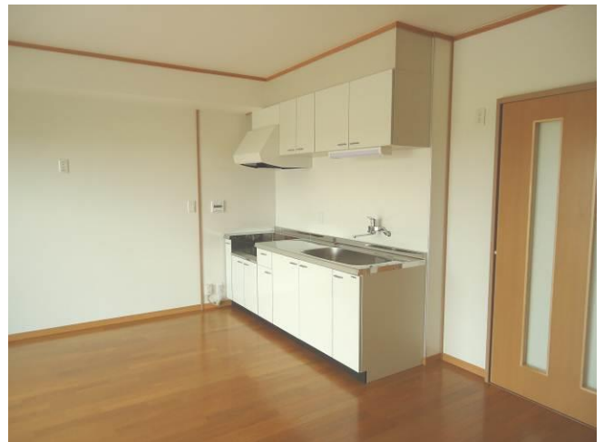
リビング・ダイニング（2LDK）